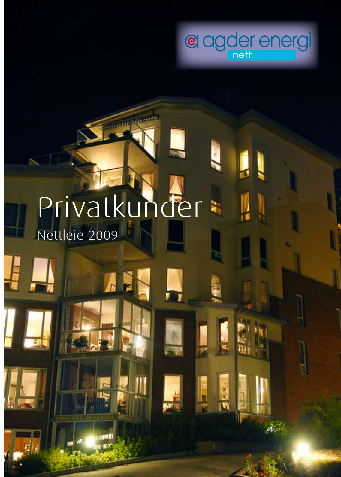
Layout og trykk: www.birkeland-trykkeri.no