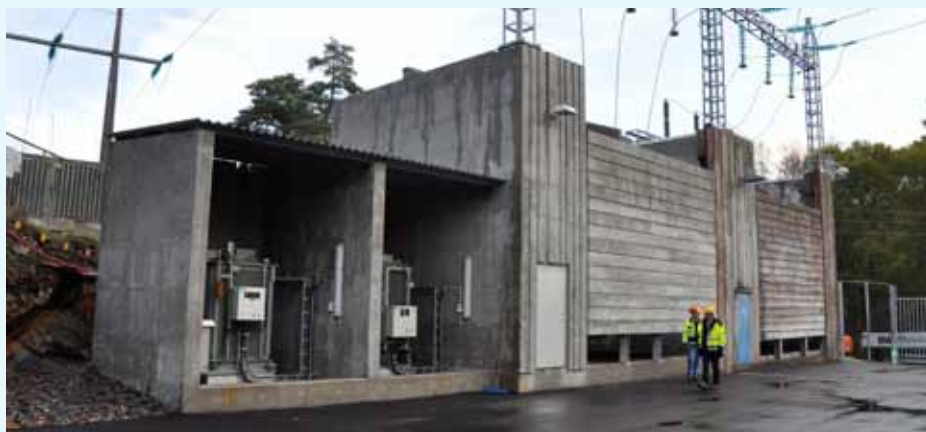
Den nye transformatoren på Frikstad styrker strømforsyningen i Randesund i Kristiansand.